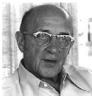
Карл Рэнсом Роджерс (Carl Ransom Rogers) 1902–1987, американский психолог, один из создателей и лидеров гуманистической психологии