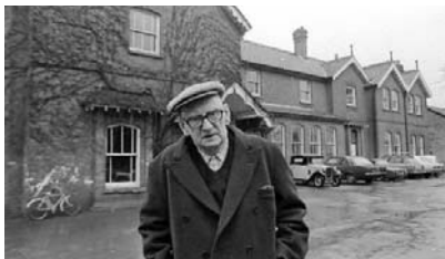
Александр Сазерленд Нилл (Alexander Sutherland Neill) 1883–1973, автор книг о воспитании детей, основатель школы Саммерхилл в Англии.