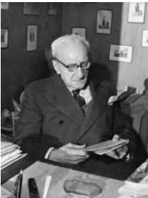
Роже Кузине (Roger Cousinet) 1881–1973, французский педагог, деятель «нового воспитания» во Франции