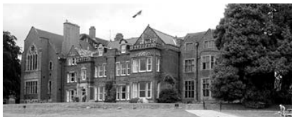
Школа, открытая Сесилем Редди (Cecil Reddie) в 1889 году в Абботсхолме (Англия) и репринтное издание его книги