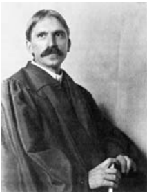
Джон Дьюи (John Dewey) 1859–1952, американский философ и педагог, представитель философского направления прагматизм