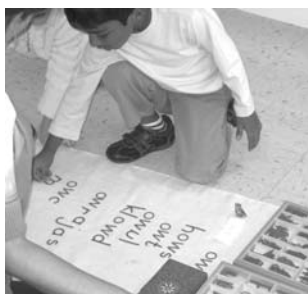
Работа учеников с монтеessori-материалом