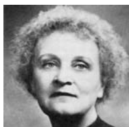
Хелен Паркхёрст (Helen Parkhurst) 1887–1973, американская деятельница народного образования, создатель метода обучения «Дальтон-план»