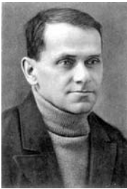
Павел Петрович Блонский 1884–1941, русский и советский философ, педагог и психолог