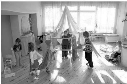
Вальдорфский детский сад «Путь зерна», г. Москва