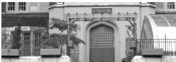
Центр образовательного проекта «Город как школа», Нью-Йорк, США